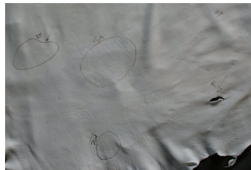
Fig. 1. Parte de uma peça de couro no estágio wet-blue com algumas regiões defeituosas marcadas a mão.

O Mato Grosso do Sul é um dos principais produtores de carne bovina do Brasil. No entanto, sua participação no mercado do couro ainda precisa ser fortalecida. Uma etapa bastante importante na cadeia do couro é a avaliação de qualidade, realizada hoje de forma não automatizada e com alto grau de subjetividade, dependendo de técnicos altamente especializados.