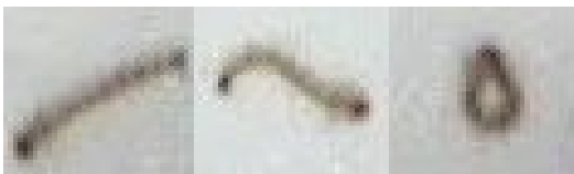
Fig. 6. Larvas em três posições distintas: aberta, curvada e fechada.

Através do projeto LARVIC, a contagem de mortalidade está sendo automatizada. As imagens são capturadas através de uma câmera posicionada acima dos recipientes contendo as larvas [7,10]. A Figura 4 mostra 6 recipientes contendo larvas em meio líquido. Pequenos trechos de imagens são analisadas periodicamente para se detectar a quantidade de larvas vivas e mortas. Além de tratar-se de um meio líquido, a introdução de ruídos no processo de captura de imagens impede que a simples detecção de falta de movimento seja utilizada para identificar larvas mortas. O reconhecimento de padrões, neste caso, está sendo utilizado em uma etapa intermediária, onde se busca identificar três formatos possíveis para cada larva: (1) aberta ou esticada; (2) curvada e (3) fechada.