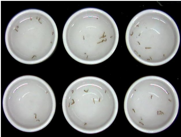
Fig. 4. Imagens de larvas do Aedes aegypti em um experimento, com 6 repetições, do teste de mortalidade.

As epidemias de Dengue ocorridas nos últimos anos despertaram o país para a necessidade de se buscar formas mais eficazes de combate ao seu mosquito transmissor, o Aedes aegypti . O Mato Grosso do Sul se destaca pela busca de novos larvicidas feitos a partir de extratos de sua diversificada flora pantaneira e de cerrado. Experimentos com novos larvicidas envolvem a análise, em várias repetições, da mortalidade de larvas utilizando diversas combinações de concentrações e extratos. Centenas e até milhares de experimentos precisam ser realizados até se encontrar uma substância que produza o efeito desejado. A contagem de mortalidade é feita por análise visual de recipientes contendo larvas expostas durante 24 horas aos produtos em teste.