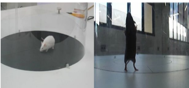
Fig. 3. Camundongos claro e escuro em posições de exploração horizontal e vertical, respectivamente, durante o experimento de campo aberto.

A utilização de camundongos na análise preliminar do efeito de novos medicamentos ou produtos biotecnológicos, de modo geral, é bastante comum. Existem diversos tipos de experimentos para medir mudanças no comportamento desses animais que podem indicar, por exemplo, algum efeito colateral de uma droga. O projeto TOPOLINO resultou em um software que automatiza o processo de medição de diversas variáveis relacionadas com os experimentos de campo aberto, labirinto em cruz e water-maze , todos envolvendo a filmagem de camundongos em situações controladas. O reconhecimento de padrões foi utilizado, neste caso, na identificação de dois tipos de comportamentos que o camundongo realiza durante o experimento do campo aberto: (1) exploração horizontal, quando o camundongo está caminhando nas 4 patas, e (2) exploração vertical, quando o camundongo sobe nas paredes laterais, de acrílico, do campo “aberto” ou se apoia nas duas patas traseiras, para realizar algum movimento livre com as patas dianteiras [7,8].